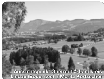
Aussichtspunkt Oberreut