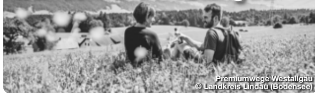
Premiumwege Westallgäu

Das Westallgäu ist eine wunderschöne Voralpenlandschaft, die zum Wandern und Erkunden einlädt. Die Region bietet auf ihren zertifizierten aussichtsreich Premiumwanderwegen über 65 Wanderkilometer, die vorbei an rauschenden Gewässern, zu weiten Ausichten und durch die Kühle des Waldes führen. Hinter jeder Kurve der Wander- und Spazierwege entdeckt man ein neues Naturerlebnis. Eine Besonderheit, die auch das Deutsche Wanderinstitut davon überzeugt hat, die sieben Wandertouren für ihre hohe Erlebnisqualität auszuzeichnen. Jeder der 3 Premium-Wanderwege und 4 Premium-Spazierwanderwege im Westallgäu hat