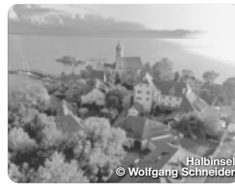
Halbinsel © Wolfgang Schneider