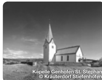
Kapelle Genhofen St. Stephan

Alle Termine und Angaben unter Vorbehalt!